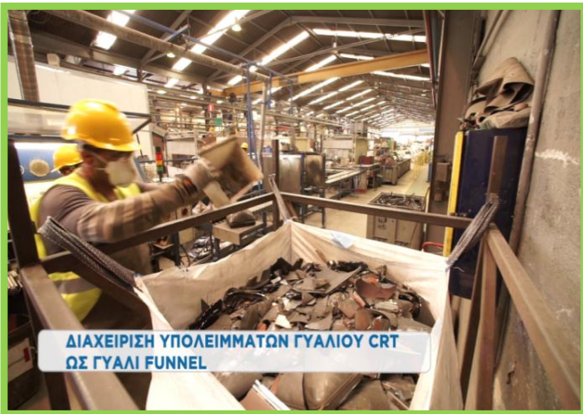
ΔΙΑΧΕΙΡΙΣΗ ΥΠΟΛΕΙΜΜΑΤΩΝ ΓΥΑΛΙΟΥ CRT ΩΣ ΓΥΑΛΙ FUNNEL

Διαχειριζόμαστε όλα τα υπολείμματα γυαλιού μαζί με το γυαλί funnel