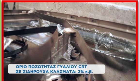
ΟΡΙΟ ΠΟΣΟΤΗΤΑΣ ΓΥΑΛΙΟΥ CRT ΣΕ ΣΙΔΗΡΟΥΧΑ ΚΛΑΣΜΑΤΑ: 2% κ.β.

Προσέχουμε ώστε τα αφαιρούμενα electron guns και tv yokes να μην περιέχουν υπολείμματα γυαλιού CRT.