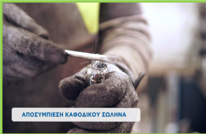
ΑΠΟΣΥΜΠΙΕΣΗ ΚΑΘΟΔΙΚΟΥ ΣΩΛΗΝΑ

Αφαιρούμε πάντα τα Υλικά Ειδικής Διαχείρισης, όπως καλώδια τροφοδοσίας, πυκνωτές, πλακέτες, μπαταρίες και λαμπτήρες.