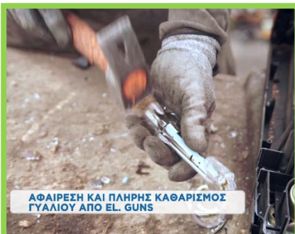
ΑΦΑΙΡΕΣΗ ΚΑΙ ΠΛΗΡΗΣ ΚΑΘΑΡΙΣΜΟΣ ΓΥΑΛΙΟΥ ΑΠΟ EL. GUNS

Αποσυμπιέζουμε πάντα τον καθωδικό σωλήνα έτσι ώστε να αποφεύγονται τυχόν ατυχήματα από τη θραύση.