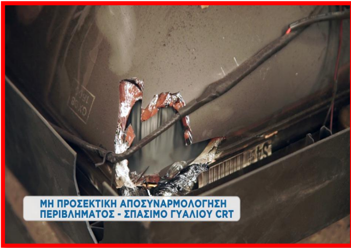
ΜΗ ΠΡΟΣΕΚΤΙΚΗ ΑΠΟΣΥΝΑΡΜΟΛΟΓΗΣΗ ΠΕΡΙΒΛΗΜΑΤΟΣ - ΣΠΑΣΙΜΟ ΓΥΑΛΙΟΥ CRT

Πραγματοποιούμε την αποσυναρμολόγηση του εξωτερικού περιβλήματος με προσοχή έτσι ώστε να μην σπάσει ο καθωδικός σωλήνας.