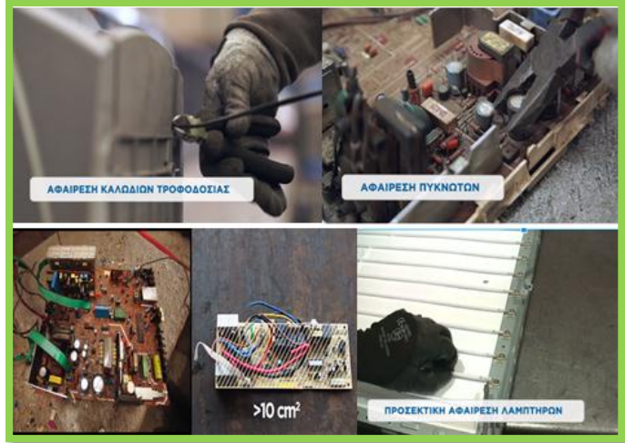
ΑΦΑΙΡΕΣΗ ΚΑΛΩΔΙΩΝ ΤΡΟΦΟΔΟΣΙΑΣ

Πραγματοποιούμε την αποσυναρμολόγηση του εξωτερικού περιβλήματος με προσοχή έτσι ώστε να μην σπάσει ο καθωδικός σωλήνας.