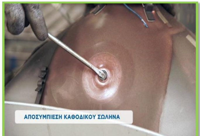
ΑΠΟΣΥΜΠΙΕΣΗ ΚΑΘΟΔΙΚΟΥ ΣΩΛΗΝΑ

Αποσυμπιέζουμε πάντα τον καθωδικό σωλήνα έτσι ώστε να αποφεύγονται τυχόν ατυχήματα από τη θραύση.