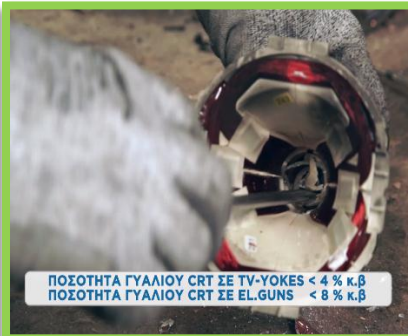
ΠΟΣΟΤΗΤΑ ΓΥΑΛΙΟΥ CRT ΣΕ TV-YOKES < 4 % κ.β ΠΟΣΟΤΗΤΑ ΓΥΑΛΙΟΥ CRT ΣΕ EL.GUNS < 8 % κ.β