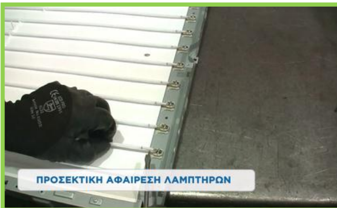
ΠΡΟΣΕΚΤΙΚΗ ΑΦΑΙΡΕΣΗ ΛΑΜΠΤΗΡΩΝ

Καλή πρακτική αποτελεί η μη ανάμειξη του γυαλιού funnel και frit με το panel. Σε περίπτωση ανάμιξης θα πρέπει να διαχειρίζεται ως γυαλί funnel